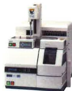
STA7200RV+RV-3TG オートサンブラ付