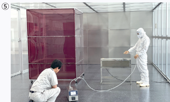
フロアーコーチ内で粉じんを測定(検証デモイメージ)