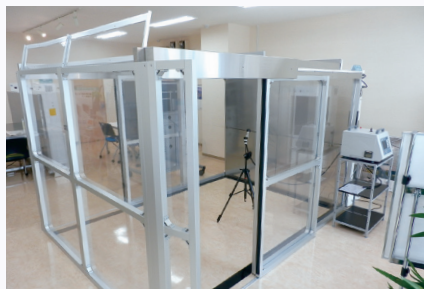
大阪ショールーム 所在地: 大阪府大阪市東淀川区東中島1-17-18 新大阪ビル東館