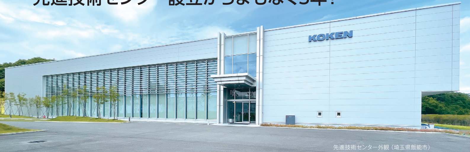
先進技術センター外観（埼玉県飯能市）