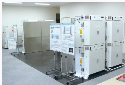
九州ショールーム 所在地: 福岡県久留米市諏訪野町1903-20