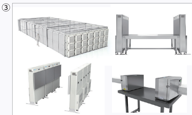
KOACHシリーズの各種ラインナップ

「作業での発塵状況を確認して、レイアウトを検討したい」「粉体材料が気流で飛ばないか確認したい」「食品の菌対策に有効かサンプルを取りたい」など、お客様の条件に合わせた性能検証の要望をいただくこともございます。環境テクニカルサイトでは、お客様の機器や素材を持ち込んでの検証等も承っております。他のショールームでも対応できる場合もございますので、詳細はご相談ください。