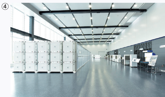
先進技術センターでは、国内最大級のフロアーコーチを展示