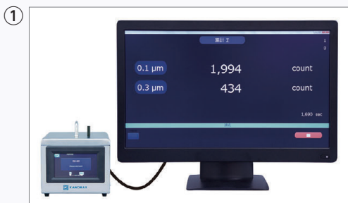
0.1 \mu\text{m} まで測定可能なパーティクルカウンター KANOMAX MODEL3950

ショールームでは、一度に複数の機種をご覧いただくことができます。環境テクニカルサイトは、全国で唯一全ラインナップを用意しております。その他のショールームの展示機種については、前項の表をご覧ください。お客様の作業内容やご要望に合わせて、最適な機種を提案させていただきます。それぞれのサイズや特長をご確認の上、ご検討ください。