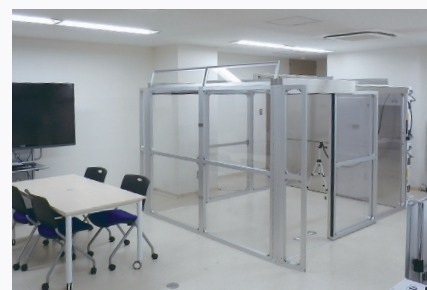
名古屋ショールーム 所在地: 愛知県名古屋市千種区今池1-26-29 ウイングオカドビル