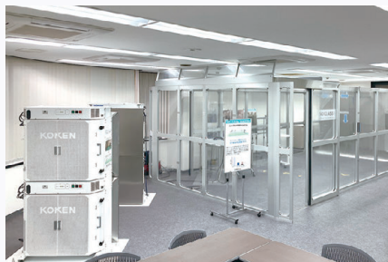
広島ショールーム 所在地: 広島県広島市中区橋本町7-14 橋本町ビル2階