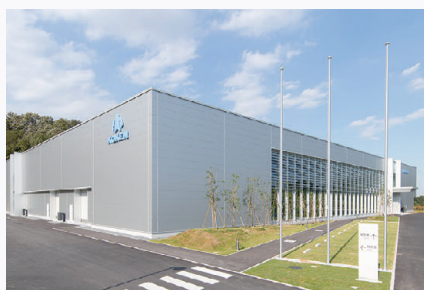
先進技術センター 環境テクニカルサイト 所在地: 埼玉県飯能市茜台3-10-1