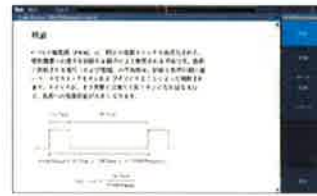
コースウェアで実習テキストも確認可能