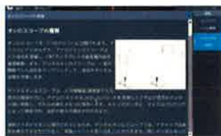
オシロで入門書を内蔵