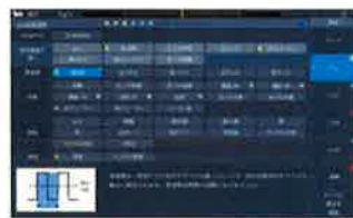
充実のHelp表示で正しい設定/選択