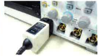
最新プローブ・インタフェース採用で 電流プローブも直接接続可能