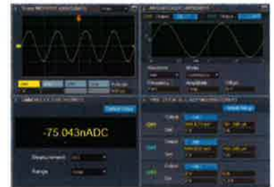
1ベンチの複数計測器の同時モニタ例