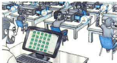
Smart Labですべてのベンチ機器を統合モニタ/制御可能

SmartLab ：教育現場向け計測・管理ソリューションで効率的な実験学習を実現！