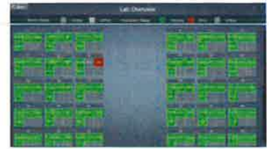
実際の実習室のベンチ配置でモニタ